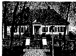
Nowogródek - Dom Mickiewicza