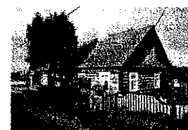
Stare Wasyliszki - Dom Niemena

10.10 środa - Wyjazd z Kielc o godz. 5.00, przekroczenie granicy w Terespolu.