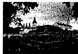
Nieśwież - Pałac